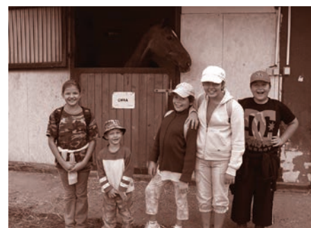
Bránit a chránit v sedle!