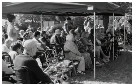
Obyvatelé domova sledují bohatý program.

Důstojné prožívání stáří, komplexní zdravotní a sociální péče včetně individuálního přístupu k uživatelům – to jsou hodnoty i jistoty, které obyvatelům Domova Sluníčko v Syllabově ulici poskytuje zdejší personál obětavě již 15 let.